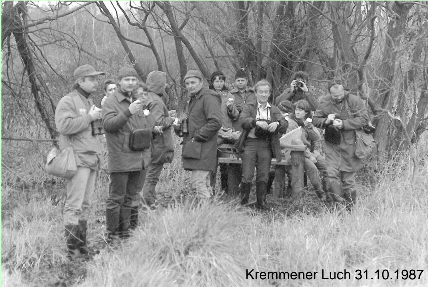
Kremmener Luch 31.10.1987