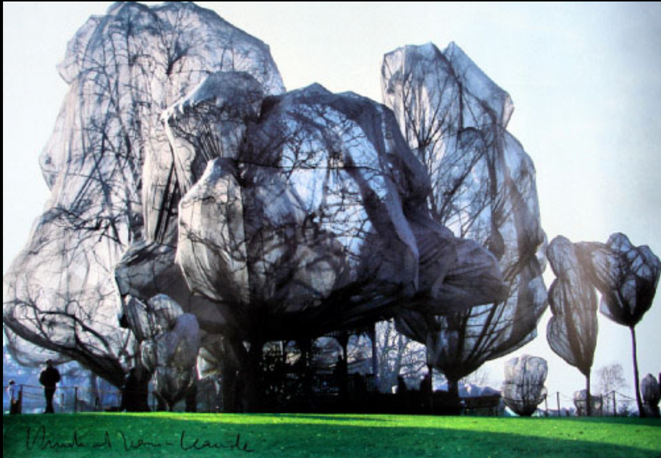
Arbre et verre - Claude